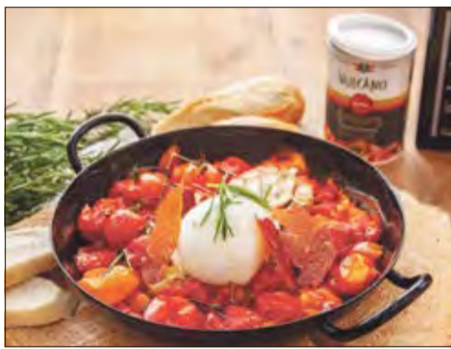
Caprese vom Grill.