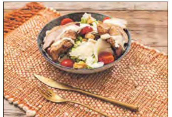
Regional und frisch genießen: Bei Lebensmitteln achten viele besonders auf die Herkunft.

Lebensmittel aus regionaler Herkunft stehen hoch im Kurs