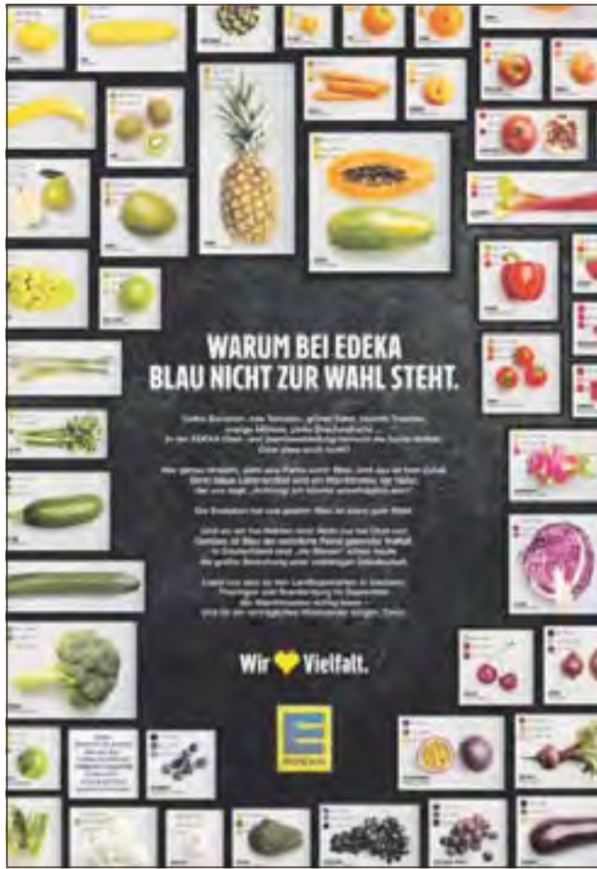
In einer Werbekampagne hat sich Edeka gegen die AfD positioniert. Vielen selbstständigen Kaufleuten geht das zu weit: Sie lehnen das Statement der Zentrale ab.

Suhl/Schleusingen/Hildburghausen. Sehr geehrte Kundschaft, sehr geehrte Leserschaft, ich beziehe mich auf Anzeigen bzw. Social Media-Posts, die bundesweit von unserer Dach-Organisation, der EDEKA-Zentrale, am 29. August 2024 geschaltet wurden. Ich als Kaufmann stehe für demokratische Werte und