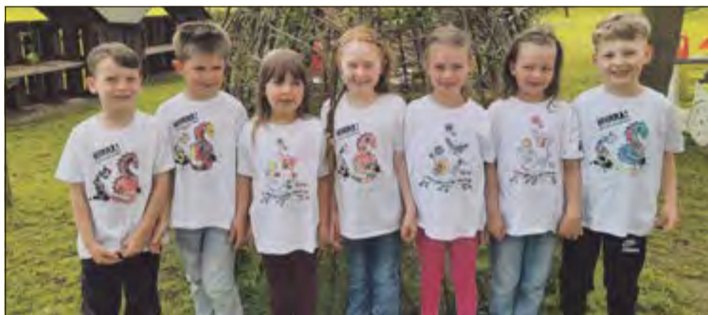
Die stolzen Schulanfänger des Kindergartens „Pusteblume“ Westhausen.