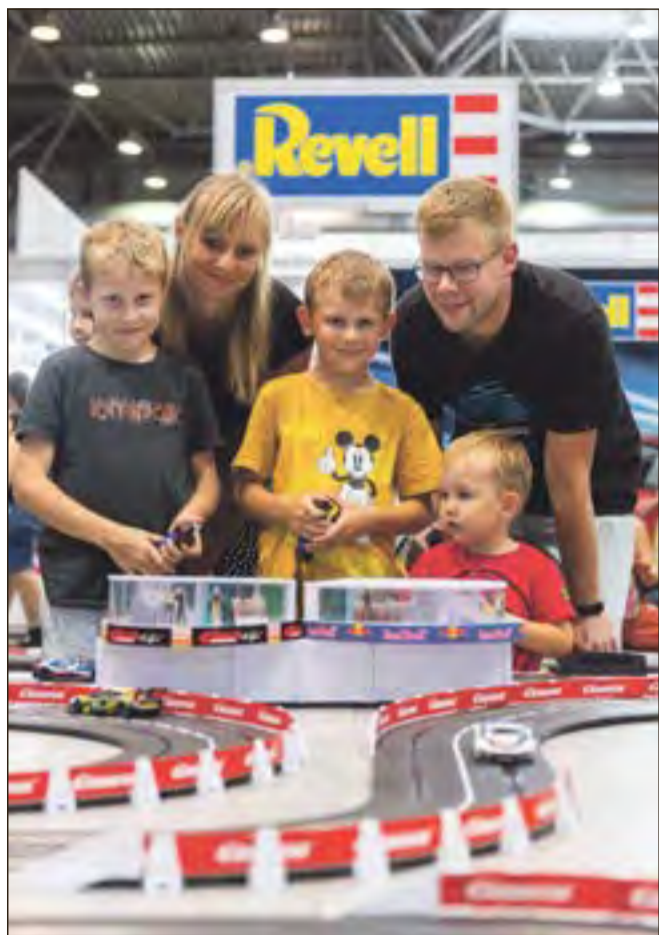
Modellbau-Enthusiasten kommen auf der Hobbymesse Leipzig voll auf ihre Kosten.

Spaß, Kreativität und gemeinsames Lernen – all das macht unser Hobby aus!