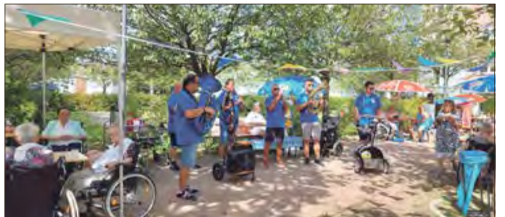
Die Gleichberg-Musikanten sorgten zum Sommerfest für die musikalische Unterhaltung.