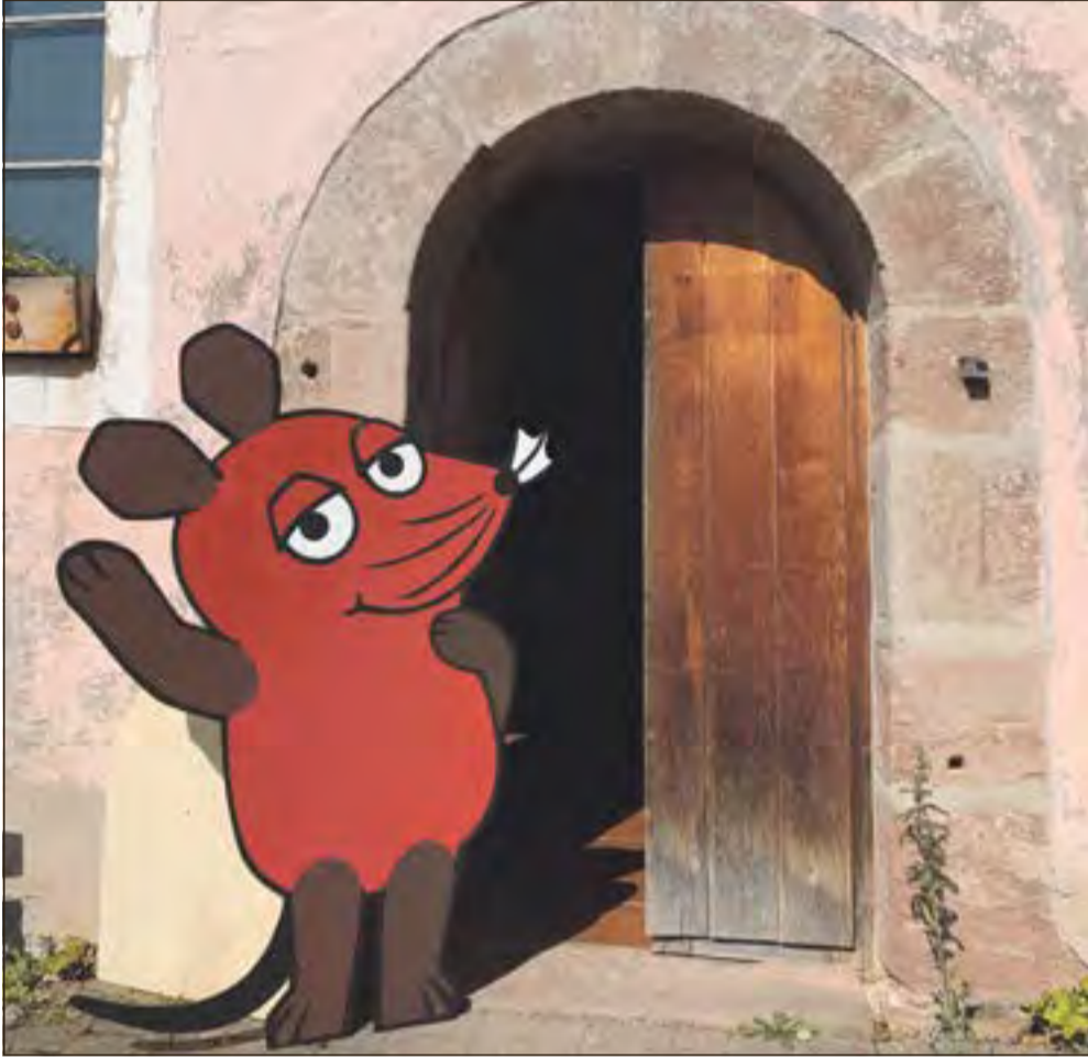
Am Donnerstag, dem 3. Oktober 2024, heißt es wieder im Hennebergischen Museum Kloster Veßra „Türen auf mit der Maus“.

Kloster Veßra. Am Donnerstag, dem 3. Oktober 2024, ist es wieder so weit: Das Hennebergische Museum Kloster Veßra macht mit beim WDR-Aktionstag „Türen auf mit der Maus“ und öffnet Türen für Besucher und Besucherinnen jeden Alters.