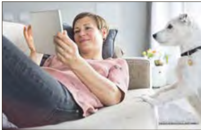
Wer einige Energiespartipps beherzigt, kann entspannt auf die Heizkostenabrechnung schauen und hat die Umwelt geschützt.

Heizsaison: So kann man Energie und Kosten sparen sowie die Umwelt entlasten