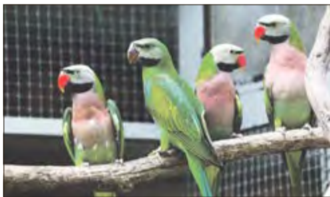
Farbenprächtige gefiederte Exoten – sie freuen sich über zahlreiche Besucher der Vogelschau in Eisfeld.

Eisfeld. Die Vogelausstellung des Vogelzuchtvereins 1973 Eisfeld e.V. findet am Samstag, dem 28. September 2024, in der Zeit von 9 bis 18 Uhr und am Sonntag, dem 29.