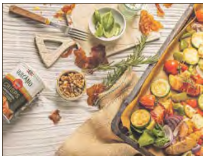
Ofengemüse mit krossen Rohschinken chips.