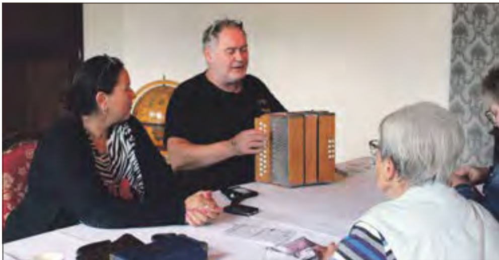
Walter Lehnertz, besser bekannt als „Waldi“ aus der TV-Show „Bares für Rares“ – er wird ein absolutes Highlight des AntikMarktes auf Burg & Park Ohrdruf sein.

AntikMarkt auf Burg & Park Ohrdruf mit Expertenschätzung von „Waldi“ aus Bares für Rares am 28. und 29. September 2024