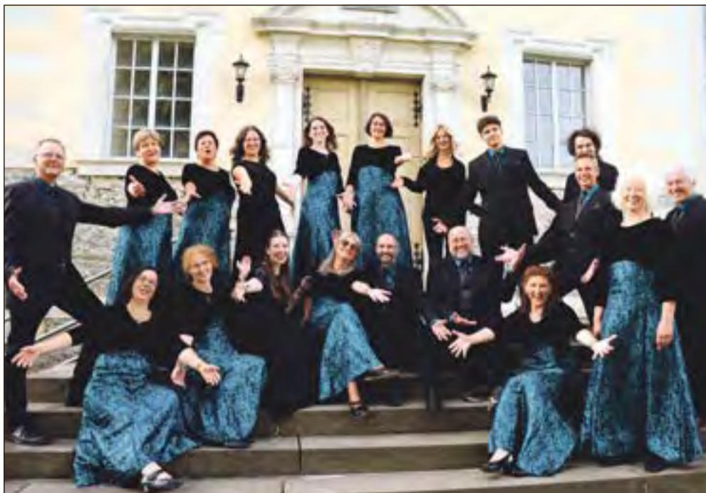
„Cocktail a cappella“.