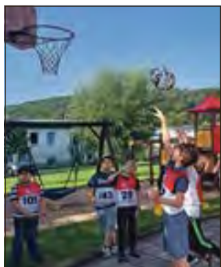
Schülerinnen und Schüler beim Basketballzielwurf zur Klassenolympiade.

Olympische Spiele 2024 an der Albert-Schweitzer-Förderschule in Hildburghausen