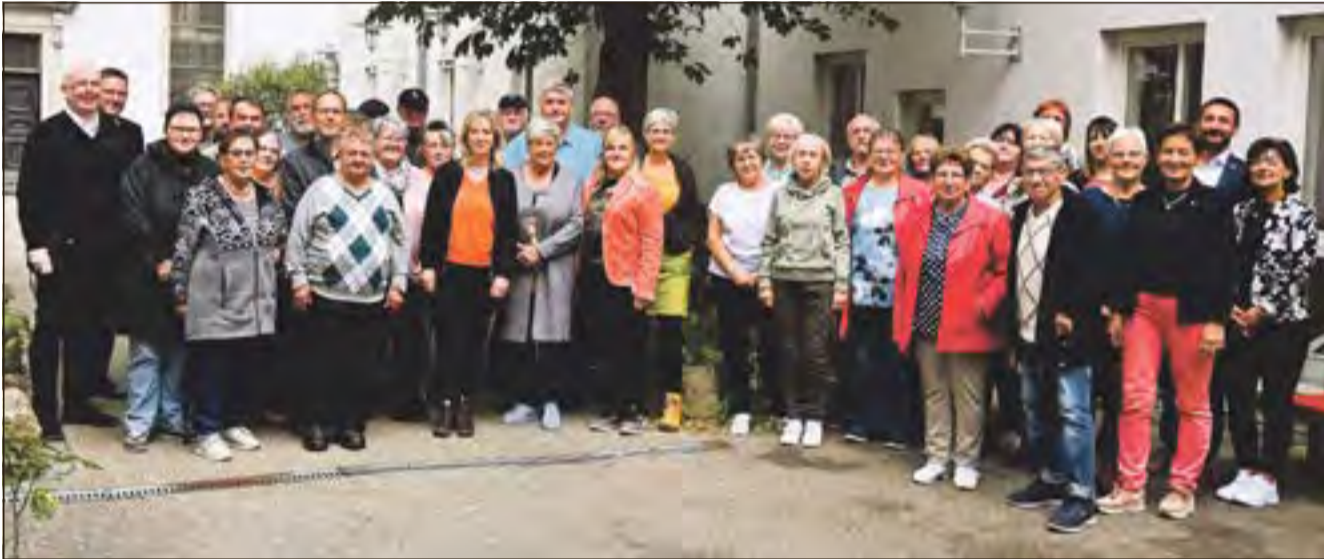
Gruppenfoto von Ehrenamtlichen, Tafelmitarbeitern und Gästen zum 15-jährigen Bestehen der Tafel.

480 Tafel-Kunden, davon 150 Kinder, versorgt die Hildburghäuser Tafel aktuell jede Woche an den Standorten Hildburghausen, Eisfeld und Schleusingen