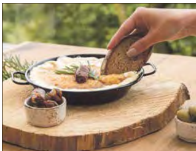
Schafskäse/Feta Creme am Grill flambiert.