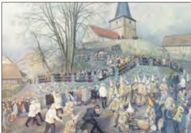
Das restaurierte Gemälde „Kirmes in Gleichamberg“.

Kloster Veßra. Das Hennebergische Museum Kloster Veßra freut sich, anlässlich des Europäischen Tags der Restaurierung am Sonntag, dem 20. Oktober 2024, sein frisch restauriertes Gemälde „Kirmes in Gleichamberg“ zu präsentieren. Das Hauptwerk des Südthüringer Malers Walter Wagner (1911-1993) erstrahlt nach fachgerechter