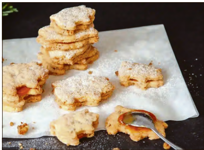
Grammelkekse sind ein Highlight im Winter!