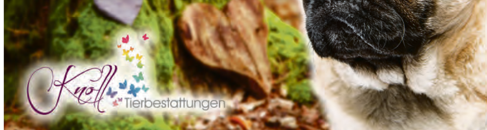
KNOLL Tierbestattungen • Untere Marktstr. 18 • Hildburghausen • Tel. 03685-700112

Wir sorgen so für dein Tier, wie du es immer getan hast.