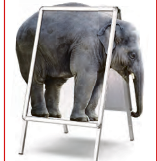
Einfache Gestaltung. Unübersehbar.